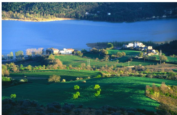
EMBASSAMENT DE TERRADETS