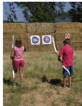
TIR AMB ARC