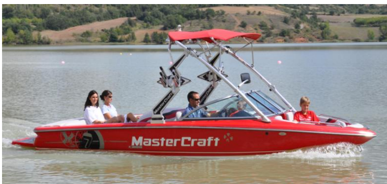
VISITA A L'EMBASSAMENT AMB EMBARCACIÓ A MOTOR